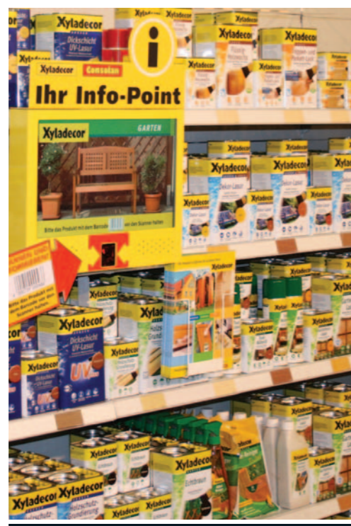
Advisory service at a DIY Store

Die softwarebasierte Systemlösung picturemachine® ist eine intelligente, modular aufgebaute Präsentations- und Steuerungssoftware, konzipiert für die Erstellung und die Distribution von multimedialem Content aller Art.