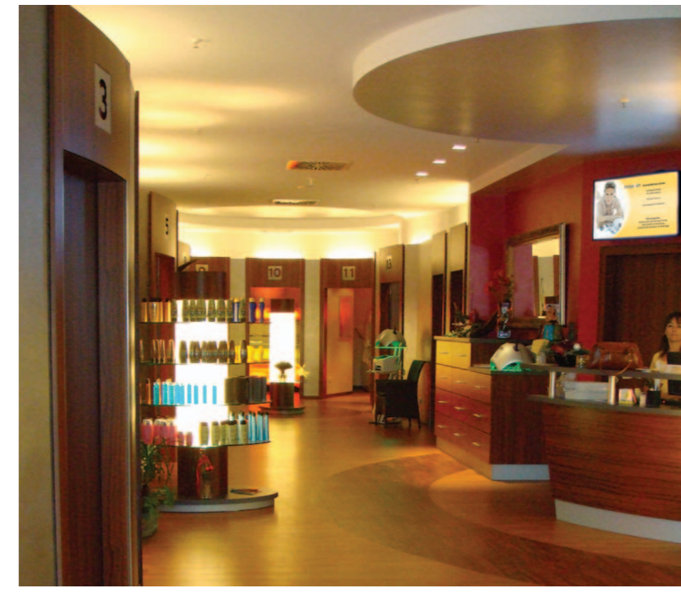
Infotainment and Commercial TV • Instore Communications

flexibly with advertising messages. Beside the simultaneous representation of videos, texts and pictures which are capable for editing it is possible to involve customers interactively into the application.